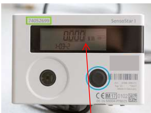
Abb. 4 Stichtag Wert in MWh Kommastelle beachten