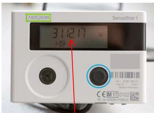
Abb. 3 Stichtag Datum