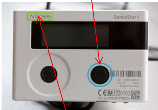
Abb. 1 Gerätenummer